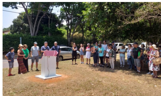
Cerimônia de reinauguração do Bosque Raffaele Benediti, com a presença dos moradores.