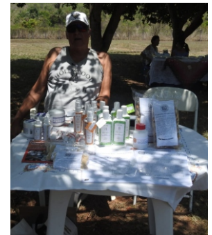
Acima: Cogumelo do Sol em diversas apresentações, e abaixo os vasos e arranjos da Sra. Rosa.